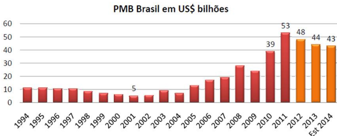
FIGURA 4 - GRÁFICO DEMONSTRANDO A PRODUÇÃO MINERAL BRASILEIRA (PMB), EM BILHÕES DE DÓLARES, NOS ÚLTIMOS 10 ANOS.