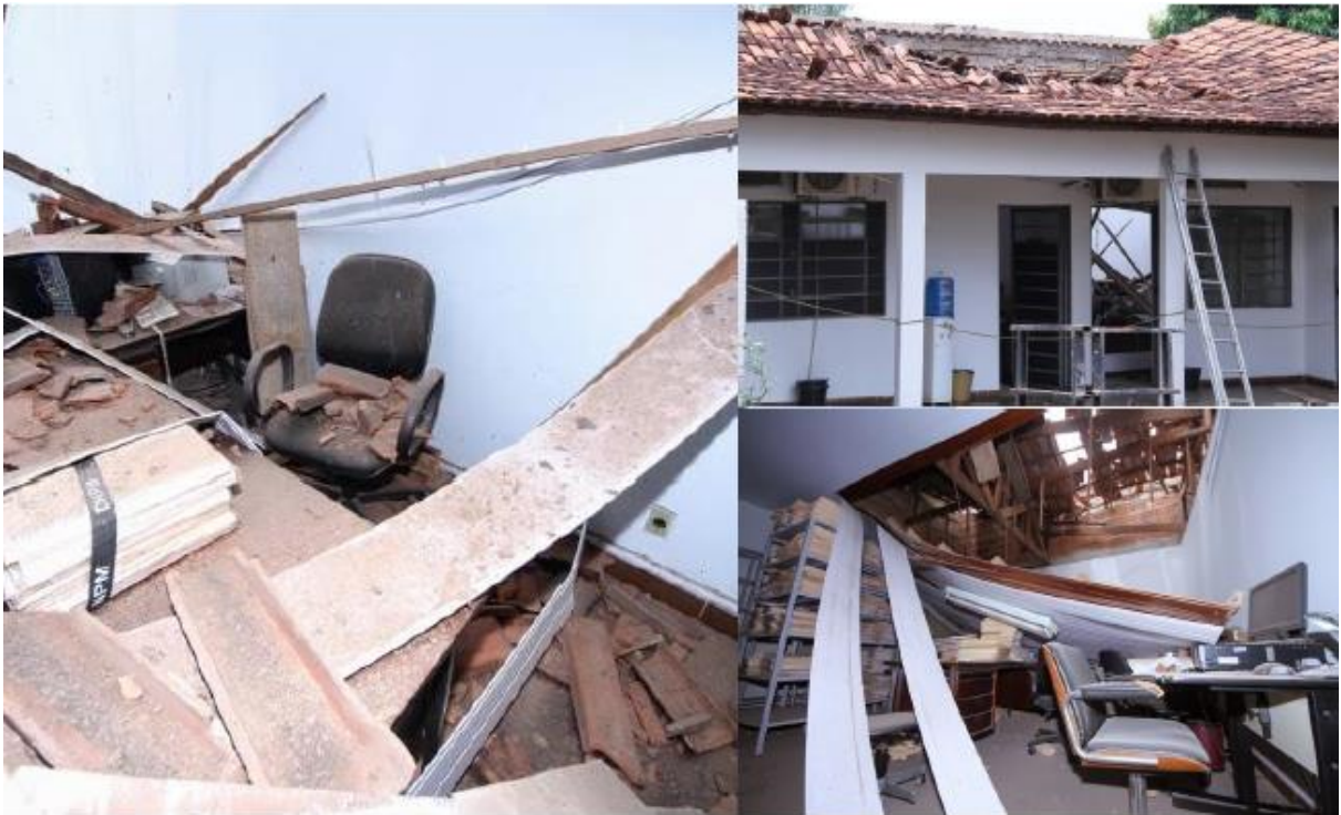
FIGURA 1 - FOTOGRAFIA DAS CONDIÇÕES PRECÁRIAS DA SEDE DO DNPM DO MATO GROSSO, FEV/2014

funcionários, aumento do número de empregados e conseqüente redução do volume de processos acumulados, bem como maior autonomia para execução das atividades a fim de manter a Agência menos sujeita a ingerências e pressões de natureza política. Além disto, a modernização do sistema, com a instituição de requerimentos eletrônicos, acabaria com as filas em frente às sedes do DNPM.